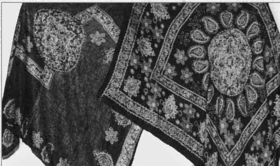
روسری چاپ کلاشه ای، کار مهسا خشنودی